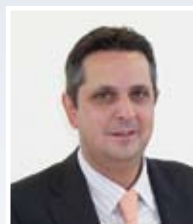
Stefan Rickert Bausparkasse Schwäbisch Hall