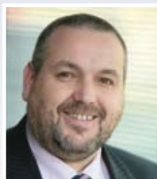
Andreas Brocks Bausparkasse Schwäbisch Hall